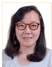
朴英 全国政协委员 清华大学航天航空学院教授

抗击新冠肺炎疫情斗争取得重大战略成果,表明中国共产党有着无与伦比的领导力和社会主义制度的优越性。危急关头,党和国家更需要民众的自觉性,更需要民众为党为国分忧的责任感,更需要民众自觉的法律意识,以及危难中能够与党和政府站在一起的坚定信念和决心。提高公民守规矩、守法律的自觉性,提高公民思想觉悟和诚信意识,是我国建设现代国家和实现社会文明的根本落脚点。疫情也让全世界更加高度关注环境,反思在现代社会商品流和服务流过程中