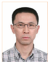
罗永章 全国政协委员 清华大学生命学院教授

新药研发,利国利民,是实施健康中国战略的重要基础。创新药物研发往往面临激烈的国内外竞争,特别是一些关系国计民生的重大医药品种,其意义早已超越了一般的商业和学术价值。保护关键核心技术,除研发主体的自我保护外,国家政策法规是否合理更加关键。加强对生物医药领域关键核心技术的保护,全面提升创新能力刻不容缓,具体建议如下: