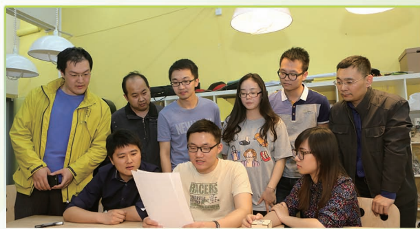
创客同学们收到李克强总理的回信,深受鼓舞。