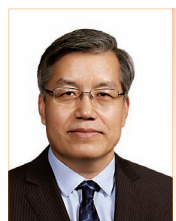
何福胜 全国人大代表 清华大学语言教学中心教授