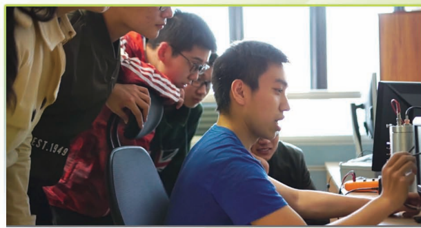
“天格计划”学生兴趣团队首颗实验卫星发射入轨并上电成功测试。