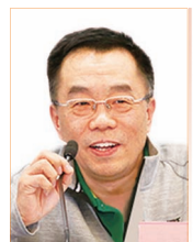
周建军 全国人大代表 清华大学土水学院教授