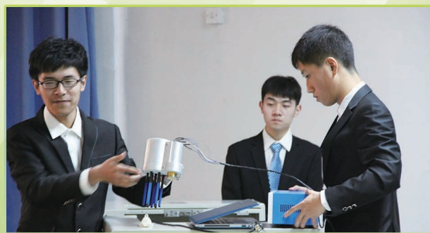
第35届“挑战杯”学生课外学术科技作品展览比赛现场。