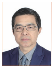
欧阳明高 全国政协常委 中国科学院院士 清华大学车辆与运载学院教授

此前,车辆工程一直是机械工程之下的二级学科,这体现了传统车辆以机械为主要特质的产品属性,符合特定时期国家和产业的实际情况,也为车辆产业的发展作出了重大贡献。如今,我国高铁已经领跑世界,为实现人员高效快速流动、解决区域发展不平衡、推动国内外经济融合提供了基础运载手段。我国汽车总产量稳居全球第一,是稳增长、保就业、促消费的关键产业之一,同时汽车科技正向低碳化、电动化、智能化、网联化的方向发展,成为新一轮科技革命交叉融合的战略高地。正是由于该领域的科技革命与产业重