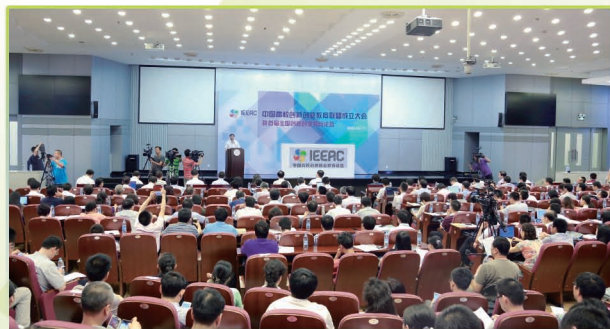
中国高校创新创业教育联盟成立。